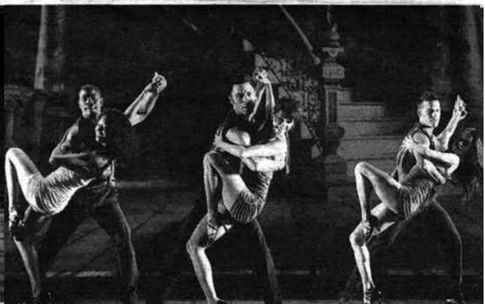
en poupe.