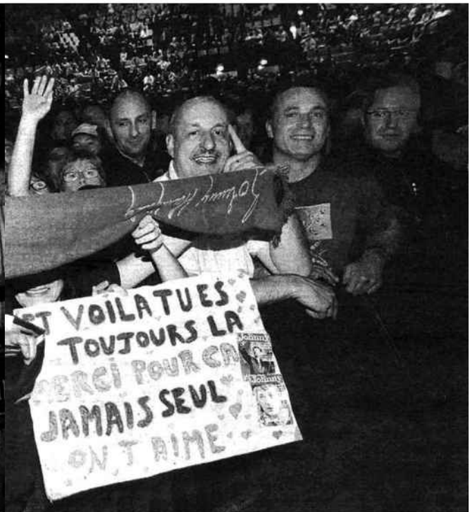
la star Johnny. Une excellente jauge pour le Zénith de Pau qui accueille plus