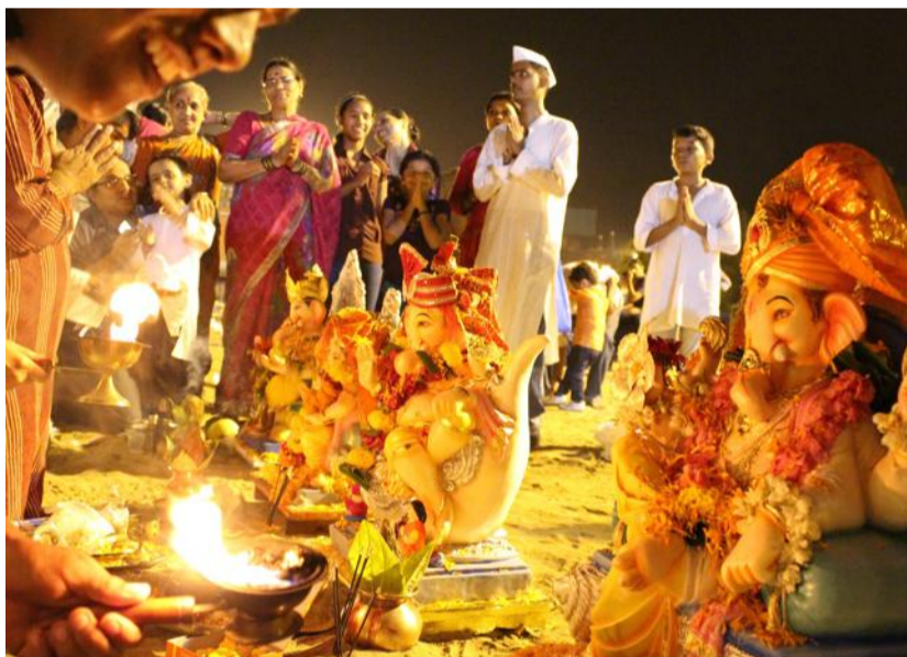
Les fêtes de Ganesh, en l'honneur du dieu éléphant, font vibrer chaque année Mumbai tout entier.

Connaître une adresse à Bombay ne suffit pas. Et pour être sûr que votre chauffeur de rickshaw vous emmènera au bon endroit, mieux vaut lui donner le nom du plus proche... cinéma. Divertissement indien par excellence, la production cinématographique du pays est à l'avenant de sa cuisine : épicée. Tout comme on mêle savamment les saveurs pour faire un bon curry, Bollywood a sa recette du « massala movie » : chansons finement chorégraphiées, rivalités, humour, grandes émotions, luxueux voyages dans la très exotique... Suisse, conflits de générations et les très attendues amours contrariées dont les chastes baisers sont signalés au public dissipé par le clignotement des lampes autour de l'écran. Dans un pays où rien n'est facile mais où tout espoir est permis, Bollywood, industrie centenaire, reste bien installée comme machine à rê-